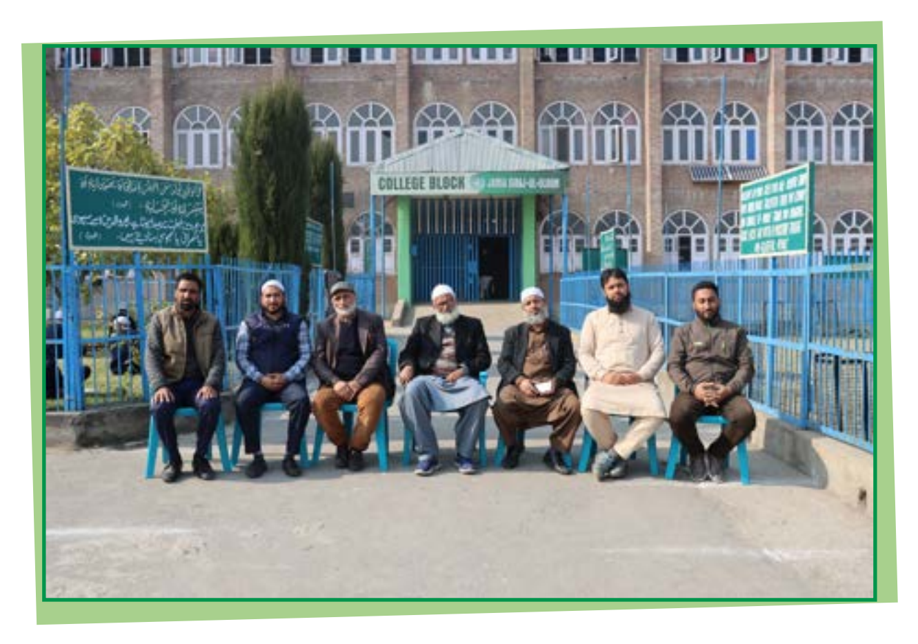
JAMIA SIRAJ-UL-ULOOM ADMINISTRATIVE STAFF