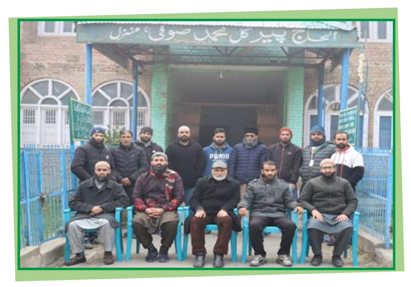
RESPECTED H.O.D WITH MIDDLE BLOCK TEACHING STAFF