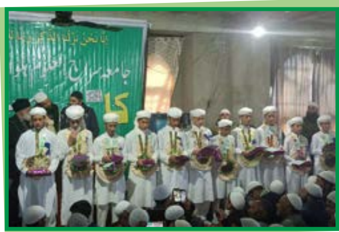
Quiz competition at University of Kashmir First Position secured by JSU