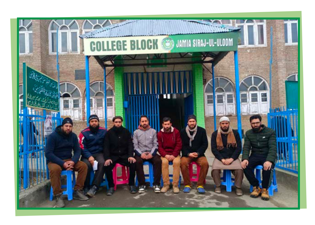
WORTHY PRINCIPAL WITH EDITORIAL BOARD