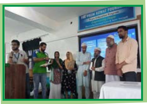
Certificate distribution by Prem Rawat Foundation team