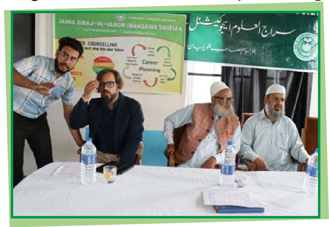
Annual Seerat Test 2022