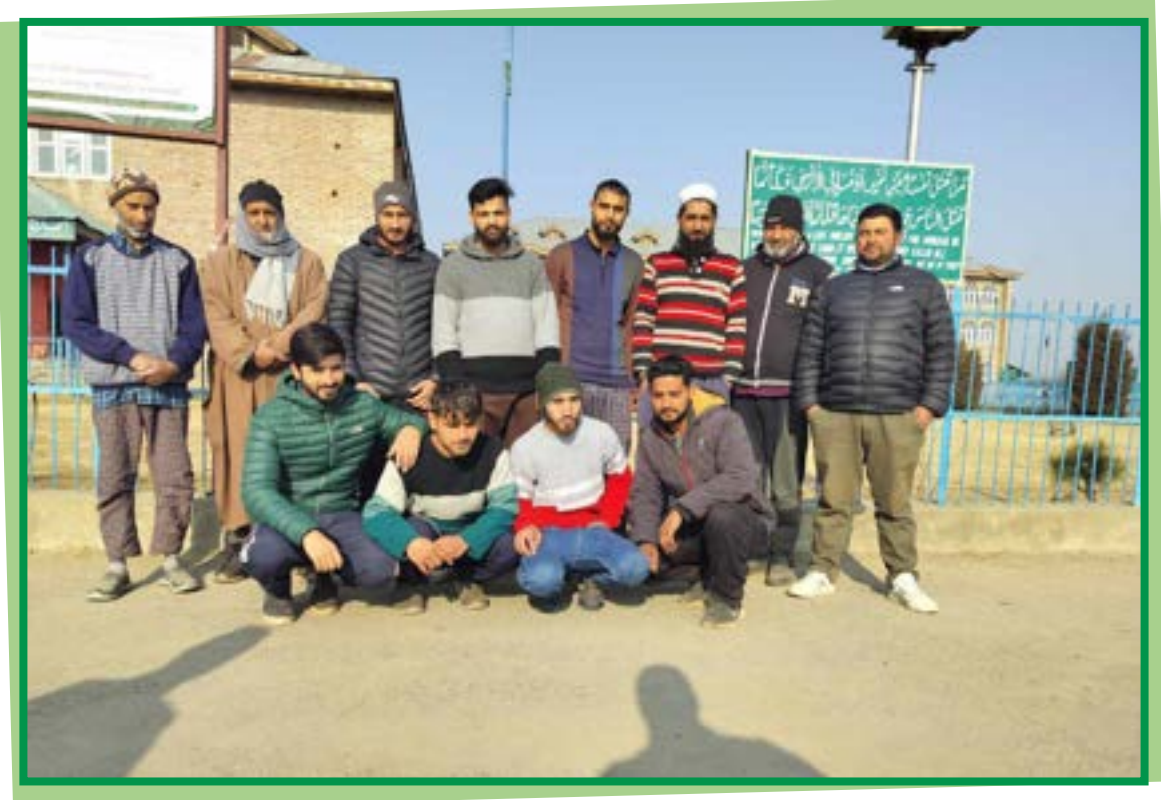
NON-TEACHING STAFF JSU