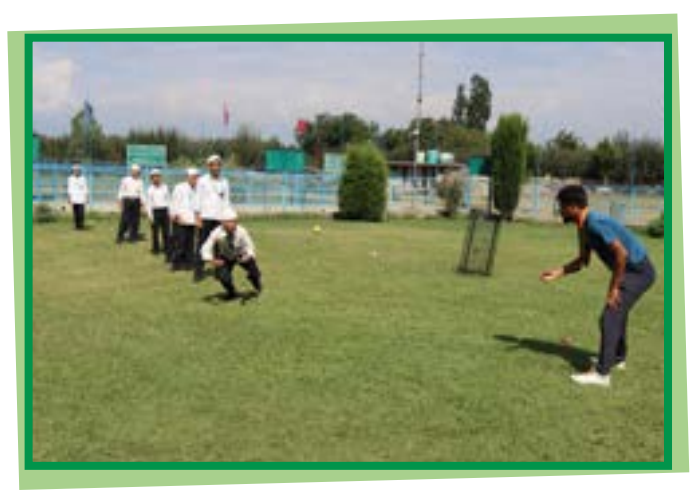
Students Training session